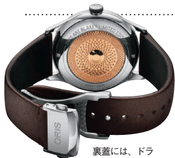
裏蓋には、ドラムのシンバルの装飾を施す。

ラー」は、大自然のシーンを切り取ったオールグラデーションウオッチ。青空や夕陽など、美しい景色を連想させるグラデーションが、すべてのパーツにハンドメイドで施されている。「アルテックガリバー」は、日本がリクエストしたネイビー×ローズゴールドが美しいビッグフェイス。