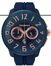
アルテックガリバー ネイビー。日本オリジナルカラー。価格5万6100円